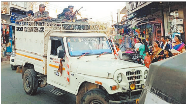
सोमवार को शहर में फ्लैग मार्च करते पुलिस के जवान।