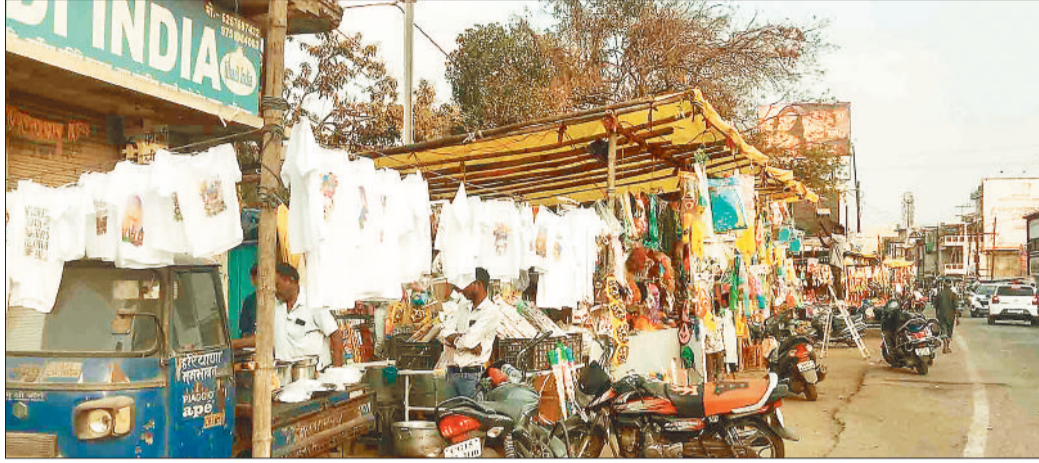
होली के लिए रंग, गुलाल व मुखौटों से सजी दुकान।

शहर के घड़ी चौक, देवीगंज रोड, स्कूल रोड, सदर रोड सहित लगी-मोहल्लों में छोटी-बड़ी दुकानें रंग चुकी हैं। थोक कारोबारियों ने भी भरपूर स्टॉक मंगाया है। इस बार अच्छी ग्राहकी की उम्मीद में व्यापारियों ने सामान लाया है। हर्बल गुलाल सहित पिचकारियों के दाम भी 10 से 20 फीसद तक बढ़ गए हैं। व्यापारियों का कहना है कि इस बार बाजार में भी रौनक है। पिछले साल को